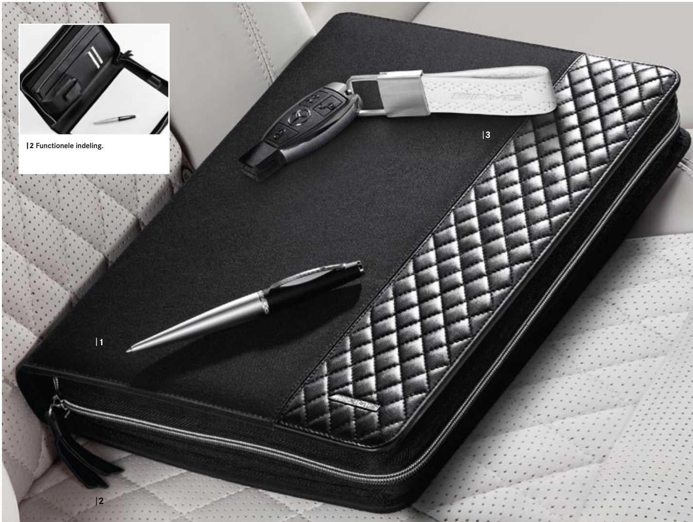
|2 Functionele indeling.