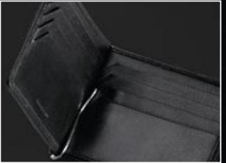
|4 Acht creditcardvakken, uitneembare bankbiljettenclip.