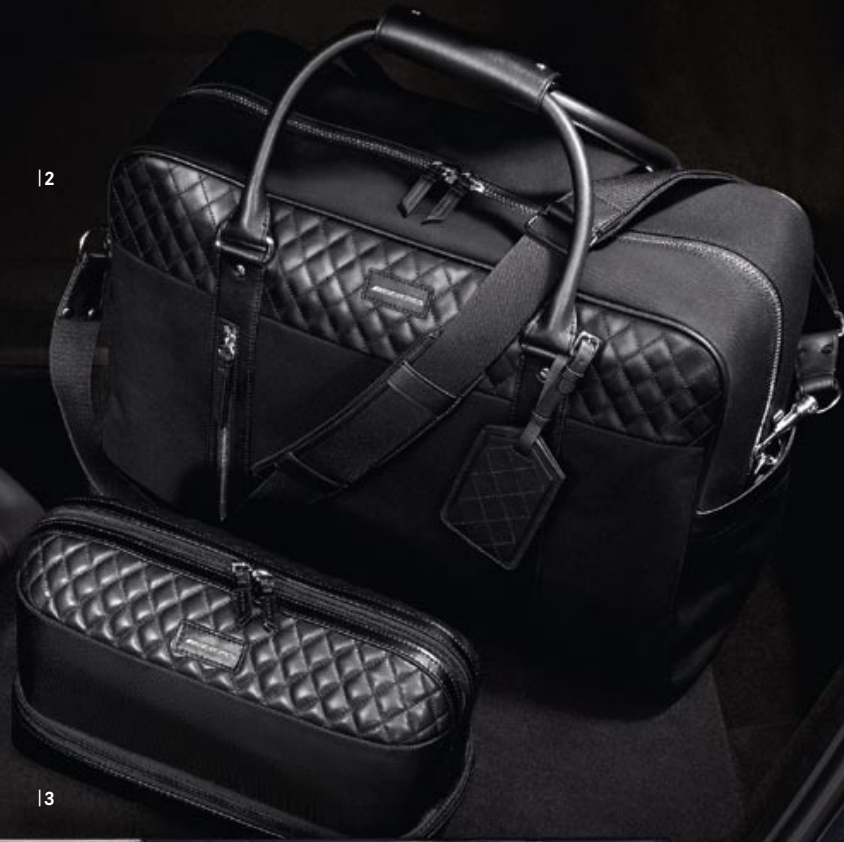
|2 BUSINESSSTAS Zwart , materiaal buitenzijde 100% katoen en kalfsleder met gestikt ruitpatroon, voering 100% nylon, praktische indeling, afzonderlijk laptopvak (tot max. 38,1 cm (15 inch)) met drukknop, buitenvak met ritsluiting, gevoerde schouderriem, kofferlabel, metalen AMG-logo, afmetingen circa 45 x 29 x 20 cm. B6 695 5737