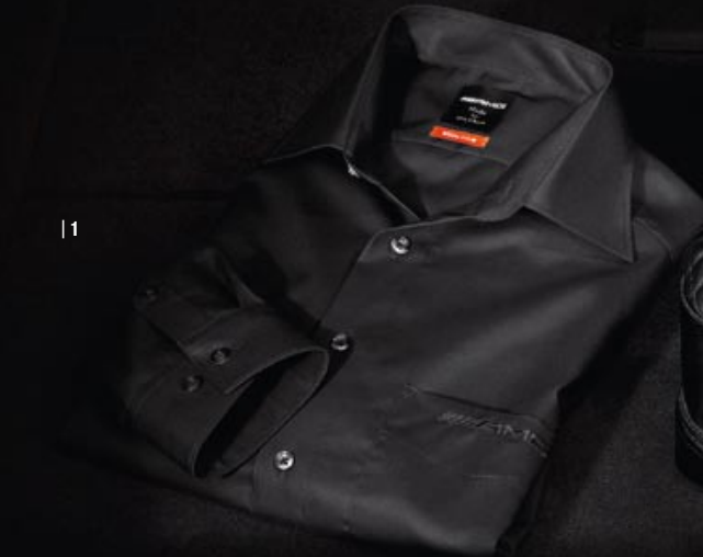
|1 OVERHEMD MET LANGE MOUWEN OLYMP HEREN Zwart , 100% katoen, Luxor-kwaliteit, kreukvrij, geborduurd AMG-logo op de borstzak, vervaardigd door Olymp voor AMG. Maten S-XXL B6 603 7396-7400