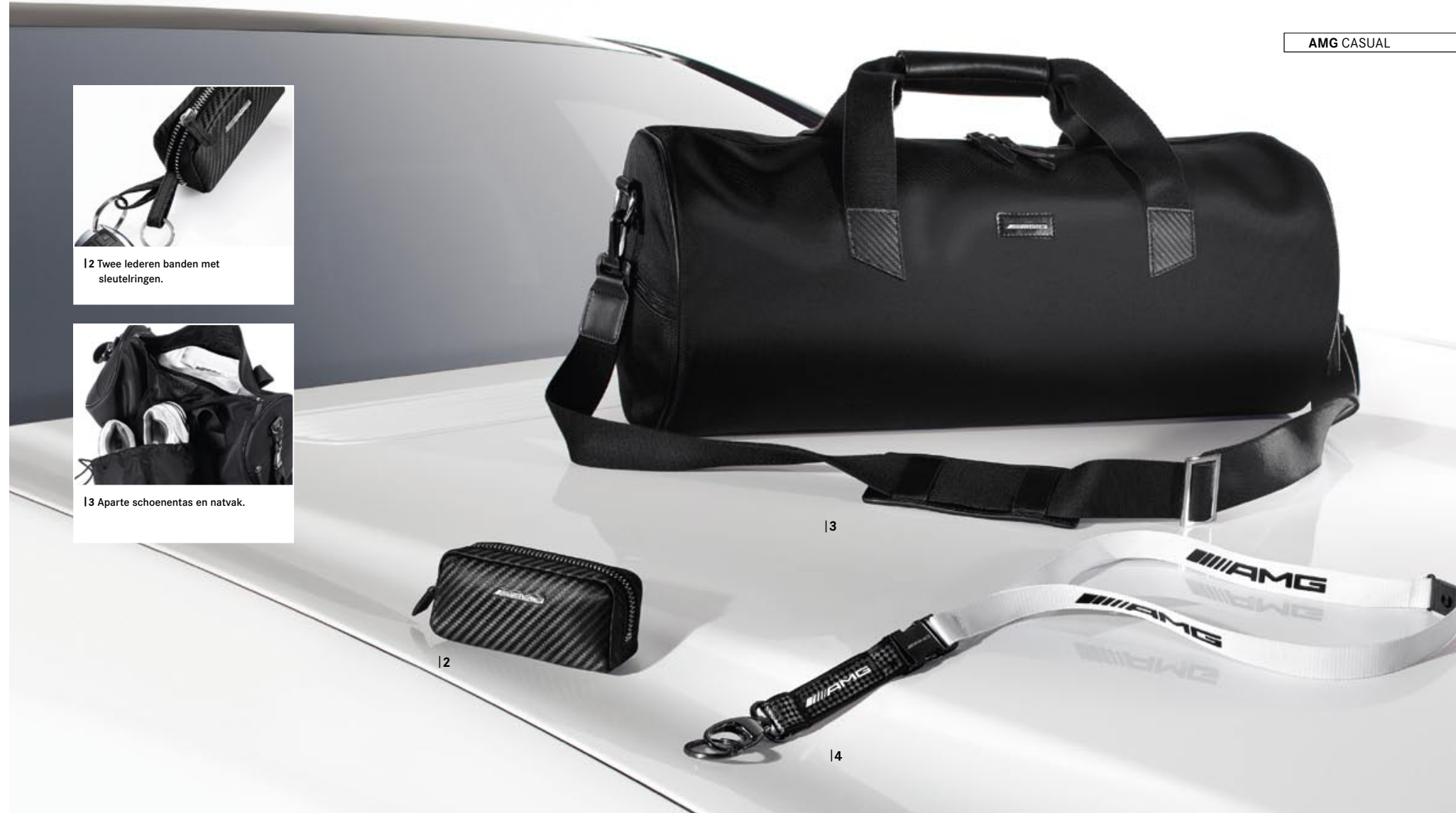
| 2 SLEUTELETUI Zwart, leder in carbonlook, ritssluiting, muntenvak met ritssluiting, twee lederen banden met sleutelringen, opschrift 'Handmade in Germany' aan de binnenzijde, metalen AMG-logo aan de buitenzijde, afmetingen circa 10,5 x 3 x 5,5 cm. B6 695 7903