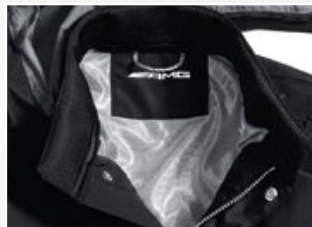
| 1 Voering van zilvergrijs netmateriaal.