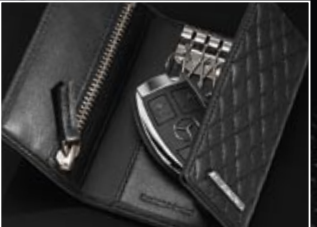
|5 Opschrift 'Handmade in Germany'.