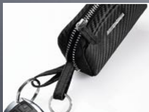
| 2 Twee lederen banden met sleutelringen.