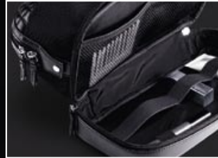
|3 Praktische indeling van het onderste, uitklapbare vak.