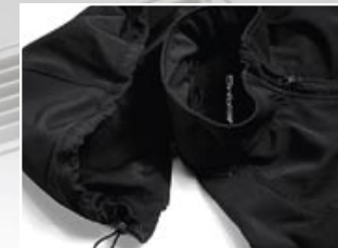
| 3 Capuchon afneembaar met ritsluiting.

| 1 WINDJACK HEREN Zwart, 100% nylon, zilvergrijze netvoering, zijzakken en borstzak, afneembare capuchon, waterafstotend en winddicht, hoogsluitende ritsluiting, mouwboorden met klittenbandsluiting, koord in zoom, zipper met AMG-logo, wit AMG-logo in de nek en op de borst. Maten S-XXL B6 695 7727-7731