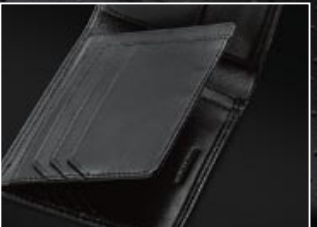
|6 Uitklapbaar creditcardvak met vier steekvakken.

|4 CREDITCARDMAPJE Zwart, lamsleder, gestikt ruitpatroon, verwijderbare clip voor bankbiljetten, acht creditcardvakken, opschrift 'Handmade in Germany', metalen AMG-logo, afmetingen circa 11,5 x 9,2 x 1 cm. B6 695 5739