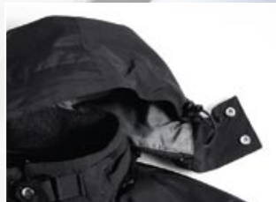
| 1 Capuchon afneembaar met ritsluiting.