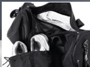
| 3 Aparte schoenentas en natvak.