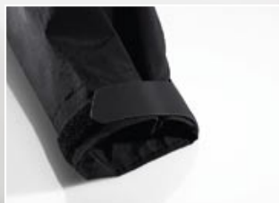
| 1 Klittenbandsluiting op de mouwboorden.