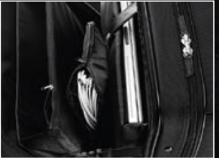
|4 Functionele indeling met uitneembare kabeltas.