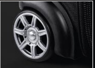
|4 Wielen in AMG-velgenlook