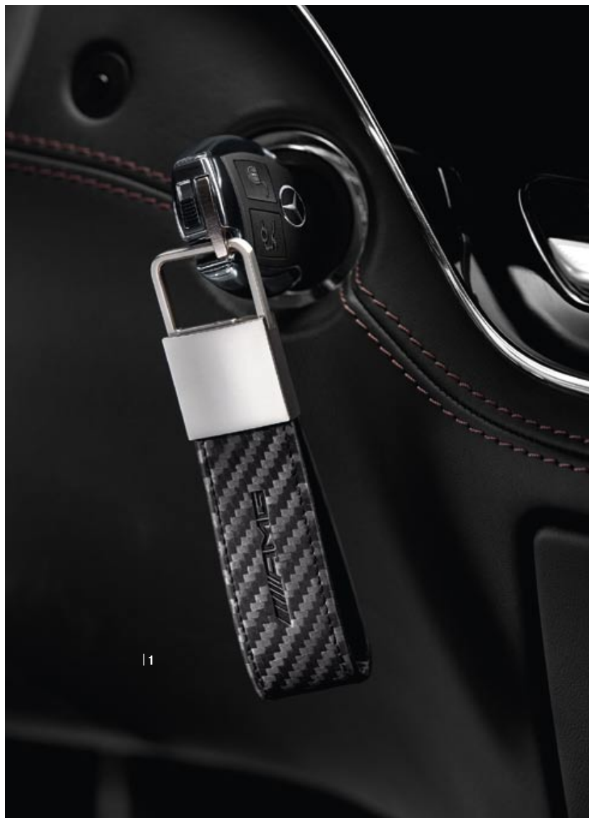
| 1 SLEUTELHANGER Zwart, leder/metaal, carbonlook, mat verchroomd, 'Handmade in Germany', AMG-reliëflogo, afmetingen circa 10,4 x 2,5 cm. B6 695 7777